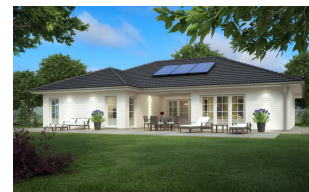
Fertighaus Bungalow SH 169 WB mit Holzfassade