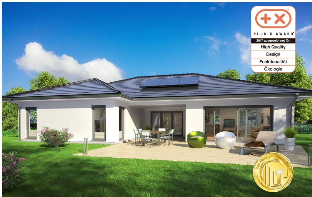
Fertighaus Bungalow SH 169 WB mit Putzfassade

https://www.scanhaus.de/fertighaeuser/bungalows/sh-169-wb