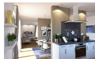
Fertighaus Bungalow SH 169 WB Küche