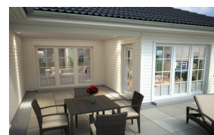
Fertighaus Bungalow SH 169 WB Terrassenansicht